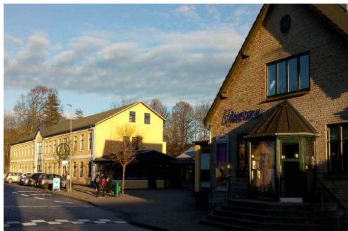
KulturStationen og Kinorevuen, Sverrigårdsvej 2-4, 9520 Skørping.

BOGBY9520 · Rebild Bibliotekerne · Mariagerfjord Bibliotekerne